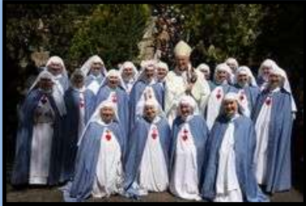
Les Petites Sœurs de la Consolation du Sacré-Cœur et de la Sainte Face

NOTRE DAME DE CONSOLATION 33, boulevard du Jardin des Plantes 83300 DRAGUIGNAN ☎ 04 94 68 26 15 ☎ 04 94 76 38 69